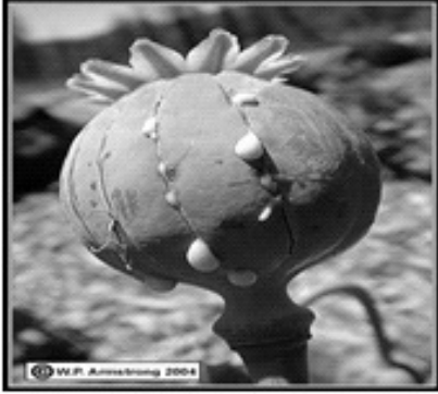
चित्र 1.4 अफीम का फल

के अवसरों पर अफीम की मनुहार करने की प्रथा आज भी है।