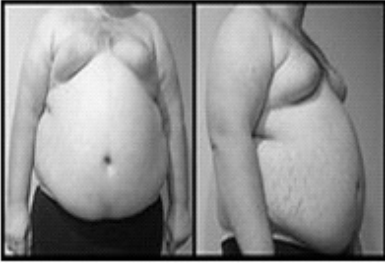
चित्र 1.2 मोटापा

घटा सकता है। शरीर भार सूचकांक (Body mass index: BMI) मानव भार व लम्बाई का अनुपात होता है। जब 25 किग्रा/मी 2 के बीच हो तब मोटापा पूर्व स्थिति और जब ये 30 किग्रा/मी 2 से अधिक हो तब मोटापा होता है।