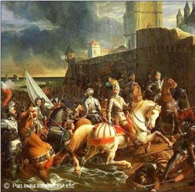
चित्र 3.1 : प्लासी का युद्ध

23 सितम्बर 1600 ई. को ब्रिटेन के प्रमुख व्यापारियों ने एक संयुक्त पूंजी उद्यम के रूप में “दी गवर्नर एण्ड कम्पनी ऑफ मर्चेन्ट्स ऑफ लन्दन ट्रेडिंग इन टू दी ईस्ट इण्डीज” के नाम से ब्रिटिश ईस्ट इण्डिया कम्पनी शुरू की। 31 दिसम्बर 1600 ई. को एलिजाबेथ प्रथम ने इस कम्पनी को पूर्व के साथ व्यापार