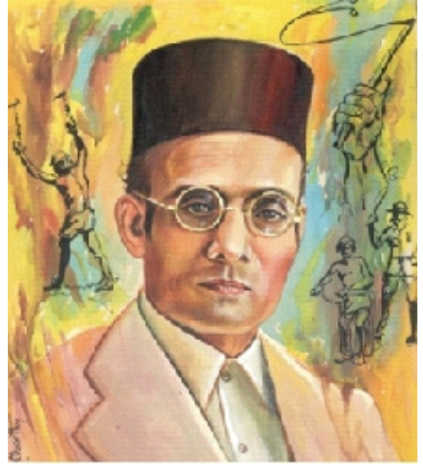
चित्र 3.6 : विनायक दामोदर सावरकर

मेला” नामक संगठन बनाकर विदेशी कपड़ों की होली जलाई। जिस कारण उन्हें कॉलेज से निष्कासित कर दिया। सावरकर एकमात्र ऐसे क्रान्तिकारी थे जिन्हें ब्रिटिश सरकार ने एक जन्म की नहीं दो जन्मों की आजीवन कारावास की सजा दी थी। उनकी पुस्तक (द इण्डियन वार ऑफ इंडिपेंडेंस) प्रकाशन से पूर्व ही ब्रिटिश सरकार ने जब्त कर ली थी। यह पुस्तक गुप्त रूप से विभिन्न शीर्षकों के नाम से भारत पहुँची थी। उन्होंने 1906 ई. में “अभिनव भारत” की स्थापना की। सावरकर पहले व्यक्ति थे जिन्होंने 1857 के संघर्ष को गदर न कहकर भारत का प्रथम स्वतन्त्रता का युद्ध बताया। सावरकर का लम्बा समय अण्डमान की सेलूलर जेल में बीता। जेल में कठोर यातनाएं दी गईं। जेल के कष्टों से परेशान होकर सावरकर ने ब्रिटिश सरकार के समक्ष दया याचिकाएं भेजी। पहली दया याचिका 30 अगस्त 1910 और दूसरी 14 नवम्बर 1911 को भेजी, जिसमें सावरकर ने स्वयं को पुर्तगाल का पुत्र कहा। लिखा कि वह सरकार के कहे अनुसार कार्य करने के लिए तैयार है। तीसरी