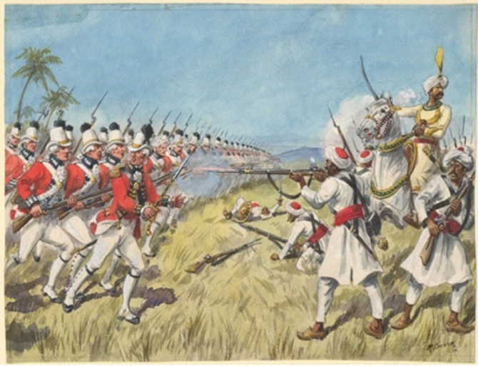
चित्र 3.2 :

18 वीं शताब्दी में भारत में मराठा शक्ति एक प्रमुख शक्ति के रूप में स्थापित हो चुकी थी लेकिन 14 जनवरी 1761 के पानीपत के युद्ध में बाद मराठों की शक्ति कमजोर हो गई। अंग्रेजों को भारत पर अधिकार करने से रोकने वाली चुनौती मराठा ही थे। अब अंग्रेज मराठों को अपने अधीन करने का अवसर तलाश रहे थे। 1772 ई. पेशवा माधवराव की मृत्यु के बाद उसका भाई नारायण पेशवा बना लेकिन पूर्व पेशवा का चाचा रघुनाथ राव पेशवा बनना चाहता था। अंग्रेजों को अब मराठा