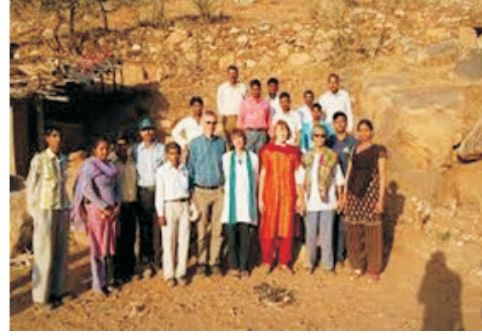
भामाशाह योजना के लाभार्थी