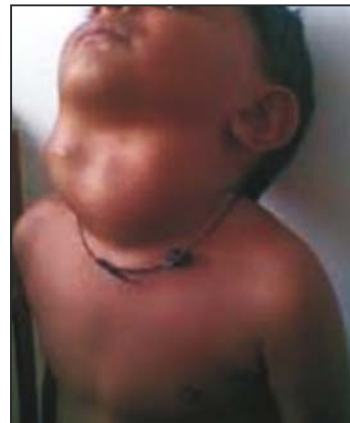
चित्र 6.2 गलगण्ड रोग

खुशी अपने पिताजी के साथ घर का सामान खरीदने बाजार गई। दुकानदार ने जब नमक की थैली दी तो पिताजी ने नमक की थैली लौटाते हुए कहा कि उन्हें आयोडिन युक्त नमक ही चाहिए। खुशी सोच में पड़ गई कि पिताजी ने आयोडीन युक्त नमक ही क्यों खरीदा ? इसका कारण पूछने पर पिताजी ने बताया कि हमारे गले में अवटु (थायराइड) नामक एक ग्रंथि