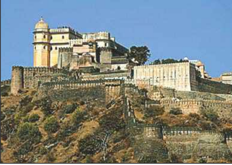
कुम्भलगढ़ किले का एक दृश्य

जाता है। इसे बुर्जियों द्वारा सुरक्षित किया गया था। महाराणा कुम्भा का 1468 ई. में स्वर्गवास हुआ।