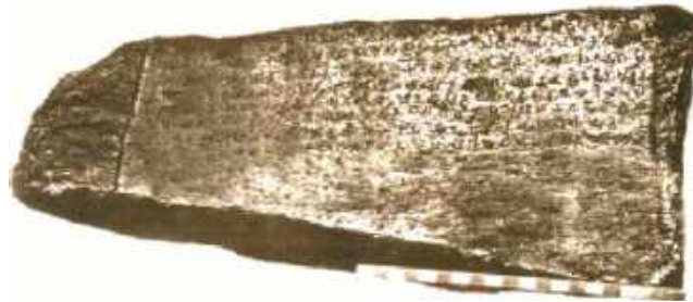
अशोक का बैराठ का शिलालेख