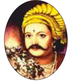
चन्द्रगुप्त द्वितीय (विक्रमादित्य)

चन्द्रगुप्त द्वितीय युद्ध क्षेत्र में जितना वीर (रणकुशल) था, शान्तिकाल में उससे कहीं अधिक कर्मठ था। वह स्वयं विद्वान् था एवं विद्वानों का आश्रयदाता था। उसके दरबार में नौ विद्वानों की एक मंडली थी, जिन्हें नवरत्न कहा गया है।