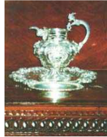
धातु की बनी वस्तु

अंग्रेजों के भारत आगमन से पहले हमारा राष्ट्रीय और अन्तर्राष्ट्रीय व्यापार बहुत समृद्ध था। भारत दूसरे देशों के साथ व्यापार ईसा से 2000 वर्ष पूर्व भी करता रहा है। मिश्र में 'मम्मीज' को भारतीय मलमल में लपेटकर रखा गया है, जो इस बात का सबूत है कि प्राचीन काल में मिश्र भारत से कपड़े का आयात करता था। यूनान में ढाका की मलमल 'गंगेतिका' नाम से बिकती थी। इसी तरह रोम में भी भारत में बनी चीजों की भारी खपत थी। मध्यपूर्व के देशों में रेशमी कपड़ों, जरी के काम, कीमती पत्थरों और धातु की बनी वस्तुओं की माँग सदैव रहती थी। चूँकि ये देश उस समय औद्योगिक दृष्टि से पिछड़े थे, इसलिए भारत उनसे आयात नहीं करता था। भारतीय व्यापारियों को निर्यात के बदले में अक्सर सोना और चाँदी मिलता था, जिसका अर्थ है कि सोने का देश के भीतर की ओर प्रवाह। देश की समृद्धि का यह मुख्य कारण बना। पहली सदी में 'प्लिनी' नामक लेखक ने शिकायत की थी कि भारतीय सामग्री के प्रयोग के कारण रोमन साम्राज्य से सोना बाहर की ओर खिंचता चला जा रहा है।