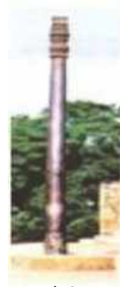
महरौली का लौह स्तम्भ