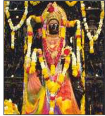
माँ त्रिपुरा सुन्दरी

त्रिपुरा सुन्दरी —माँ त्रिपुरा सुन्दरी का मंदिर बाँसवाड़ा से लगभग 19 किमी की दूरी पर स्थित है। इस शक्तिपीठ की लोक में बहुत मान्यता है। त्रिपुरा मतोपासना वैदिक काल के समकक्ष मानी जाती है और सम्पूर्ण भारत में इसका प्रसार था। आद्यजगद्गुरु शंकराचार्य के प्रयत्नों से भारतवर्ष में शक्ति उपासना की जो लहर उठी, उसी के परिणामस्वरूप देश में शक्ति पूजा का महत्त्व बढ़ा। इसी क्रम में बाँसवाड़ा का शक्तिपीठ भी त्रिपुरा सुन्दरी के नाम से प्रख्यात हुआ। राजस्थान के बाँसवाड़ा-डूंगरपुर क्षेत्र में यह देवी तीर्थ "तरतई माता" के नाम से जाना जाता है। 'तरतई' शब्द 'त्रितयी' का अपभ्रंश है, जिसका अर्थ है— "त्रित्व (तीन) से युक्त"।